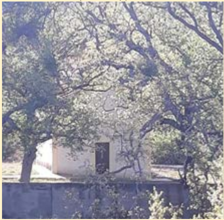
Ο Ι.Ν. μέσα στις καρυδιές και τις καστανιές Αριστερά η Ιερή Εικόνα

Η αρχή έγινε την Παρασκευή του Πάσχα στη εορτή της Ζωοδόχου Πηγής , όπου εορτάζει το εκκλησάκι της Θεοτόκου στα σύνορα με την Βαρβίτσα στις 7 Μαΐου